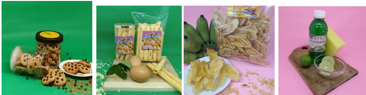
Gambar 5. Hasil Foto Beberapa Produk Peserta UMKM Desa Pengkok, Kecamatan Patuk Gunung Kidul

Pada Tabel 3 diketahui bahwa para pelaku UMKM di Desa Pengkok, Kecamatan Patuk Gunung Kidul 64% atau 9 peserta telah dapat meningkatkan ketrampilan teknik fotografi untuk menghasilkan gambar produk yang baik dan menarik.