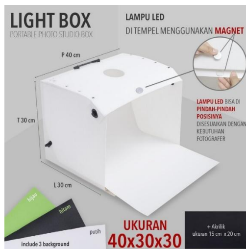
Gambar 1. Studio Box

Dengan menggunakan photobox/lightbox ini dapat menghasilkan foto objek yang terfokus dan lebih nyata. Sangat cocok di gunakan untuk yang sedang merintis atau mengembangkan bisnis usaha online shop .