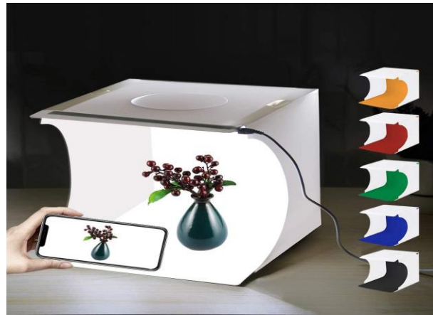
Gambar 2. Proses Pengambilan Foto Produk dengan Studio Box

Adapun teknik fotografi yang dipaparkan pada pendampingan/pelatihan antara lain menggunakan teknik tata cahaya dan tata ruang yang baik, teknik pemilihan background yang tepat, dan teknik penentuan bidang pandang gambar. Gambar 3. (a), (b) merupakan penjelasan melalui tutorial secara online tentang alat-alat pendukung lainnya. Kemudian Gambar 4. (a), (b) dilanjutkan dengan pendampingan/pelatihan teknik fotografi dengan mengikuti berbagai tips untuk mendapatkan gambar produk yang baik dan menarik.