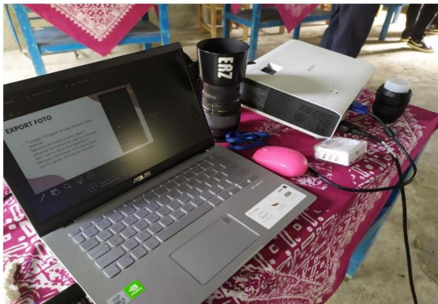
Gambar 1. Peralatan Yang Digunakan