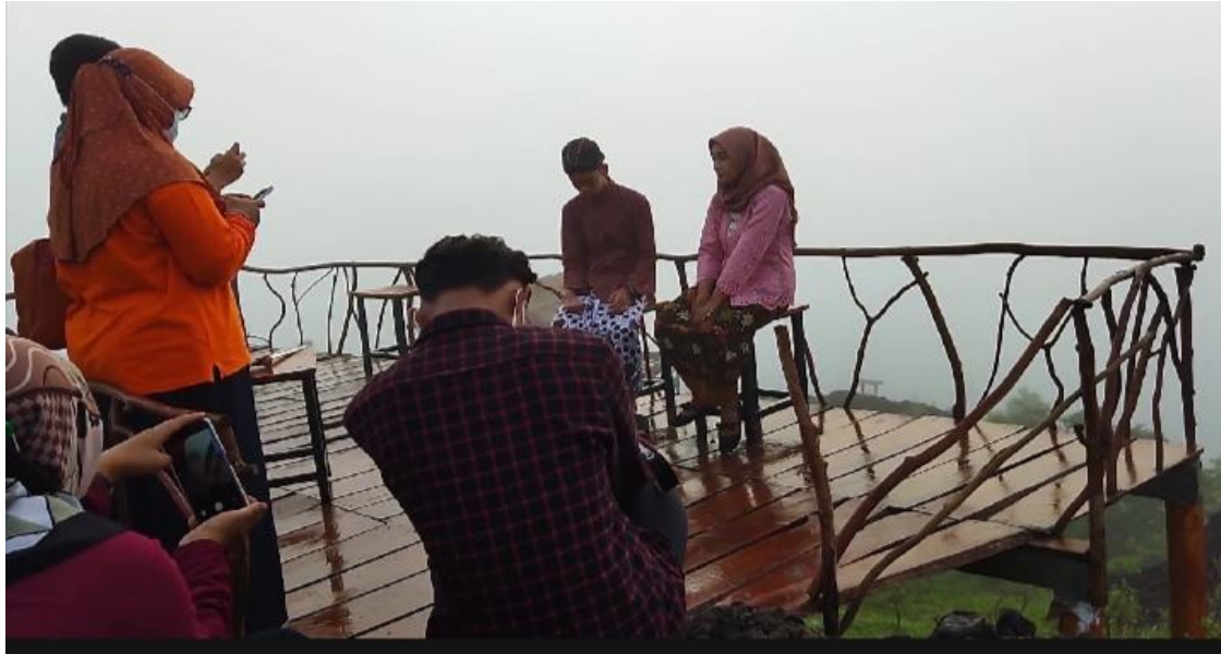
Gambar 3. Para Peserta Melakukan Praktek Pengambilan Foto Prewedding Hasil pengambilan foto prewedding yang telah dilakukan oleh 11 peserta pengabdian masyarakat salah satunya seperti terlihat pada Gambar 4.