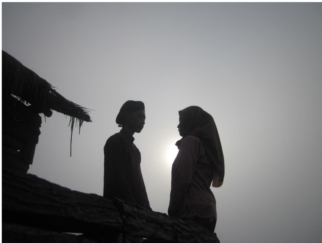
Gambar 4. Hasil Pengambilan Foto Prewedding Kemudian pada hari berikutnya, dilakukan penjelasan mengenai aplikasi storyart sebagai aplikasi yang dapat digunakan untuk editing foto. Para peserta melakukan praktek editing foto dengan menggunakan aplikasi tersebut, seperti