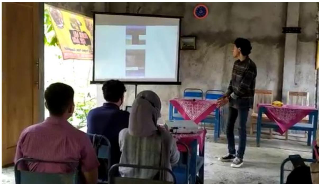
Gambar 7. Evaluasi Hasil Pengambilan Foto dan Hasil Editing Foto

Keseluruhan acara pengabdian kepada masyarakat telah dipublikasikan di media sosial Instagram dengan alamat tautan sebagai berikut: https://www.instagram.com/tv/CTzukQwDdLD/?utm_medium=copy_link dan https://youtu.be/es3CKkedK4Q .