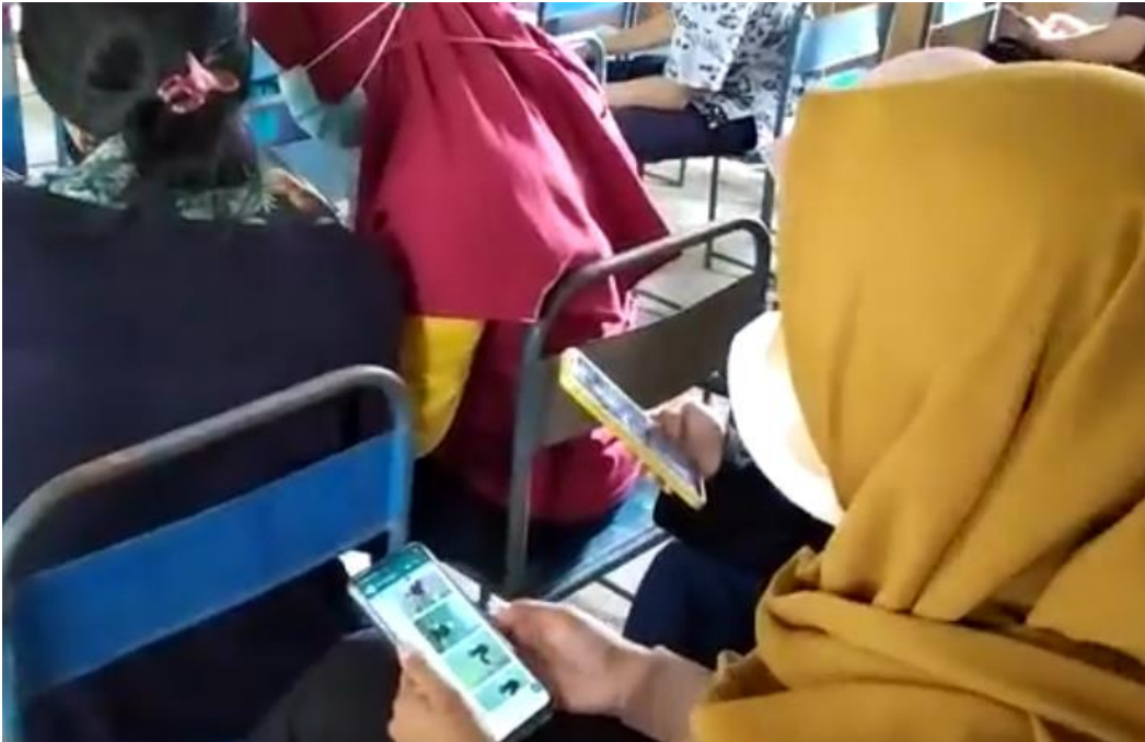
Gambar 5. Peserta Pengabdian Melakukan Editing Foto Menggunakan Aplikasi Di Smartphone

Semua hasil pengambilan foto dan editing foto yang dilakukan oleh para peserta kemudian dilakukan evaluasi apakah para peserta sudah memahami dan dapat melakukan pengambilan foto dengan teknik tertentu dan sudah dapat melakukan editing foto dengan menggunakan aplikasi storyart (seperti terlihat pada Gambar 7).