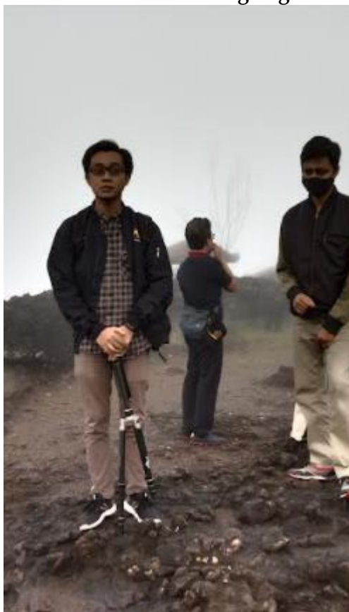
Gambar 2. Penjelasan Tentang Teknik Pengambilan Foto Prewedding

Setelah mendapatkan penjelasan mengenai teknik pengambilan foto prewedding, para peserta melakukan praktek langsung pengambilan foto prewedding di tempat wisata Gunung Ireng dengan model dari kelompok pokdarwis Gunung Ireng, seperti terlihat pada Gambar 3.